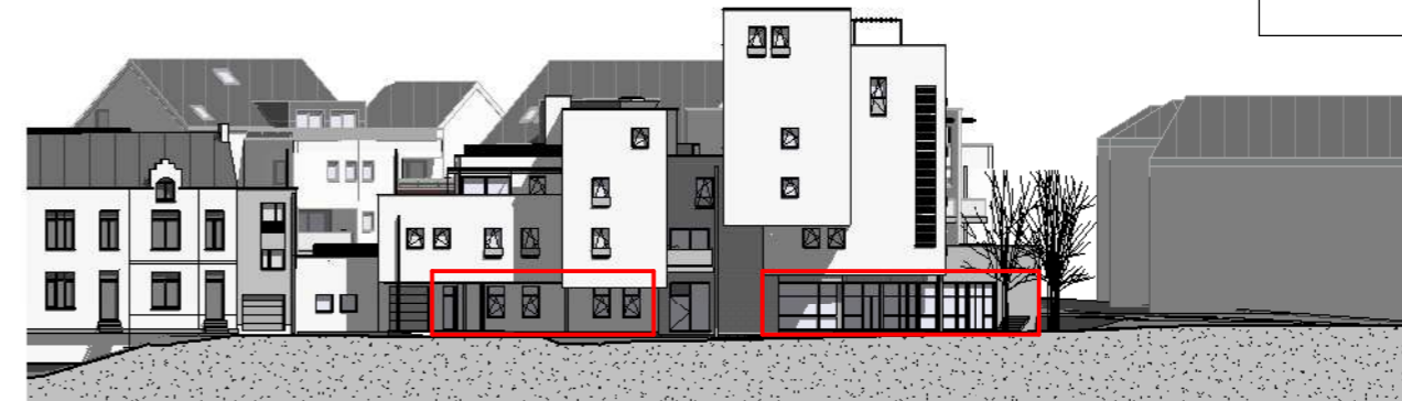
FAÇADE RUE DE LA STATION