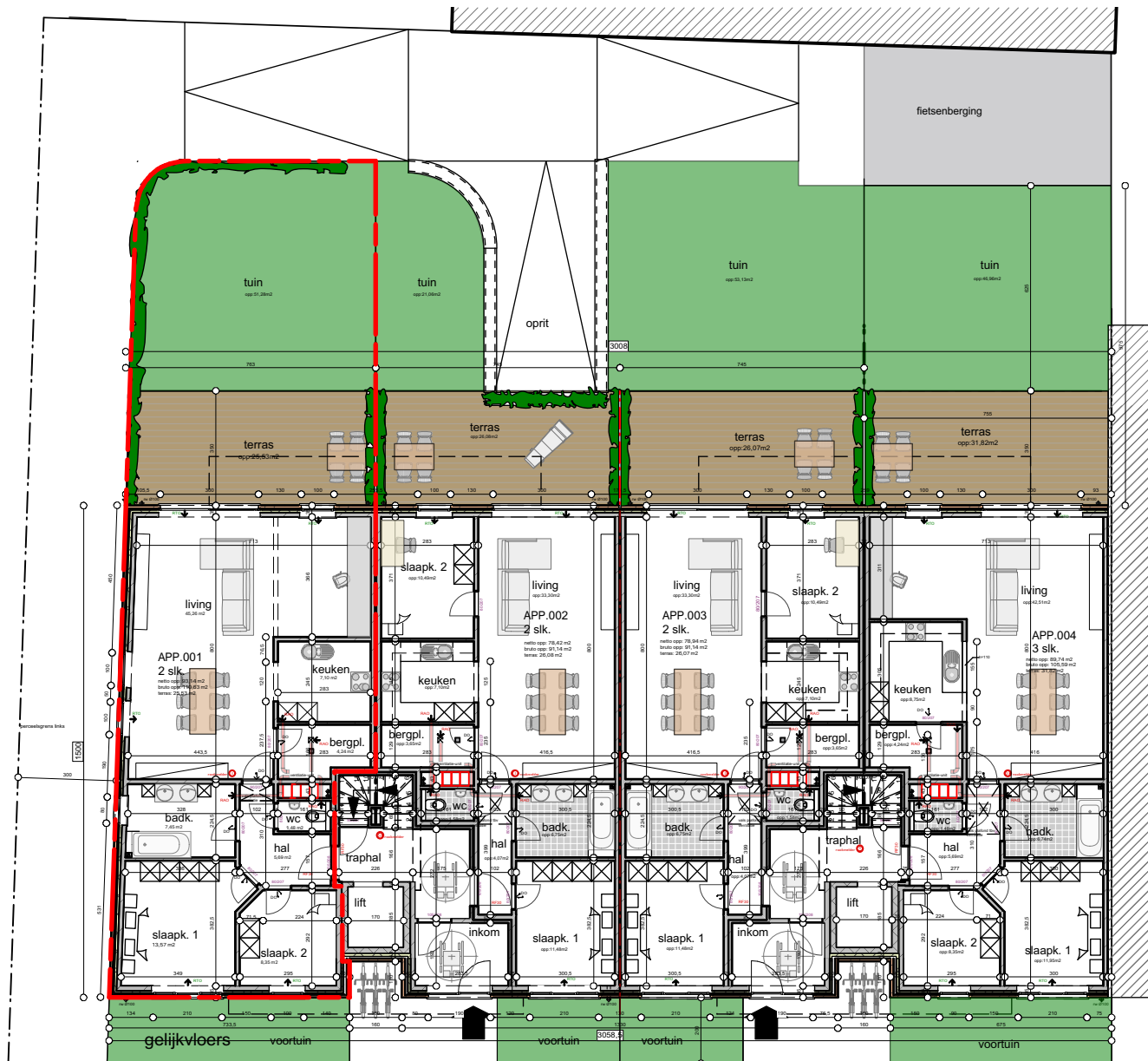
grondplan gelijkvloers 1/200

Project Bouwen van 14 appartementen met 14 ondergrondse staanplaatsen Herentalsebaan 101 2150 Borsbeek