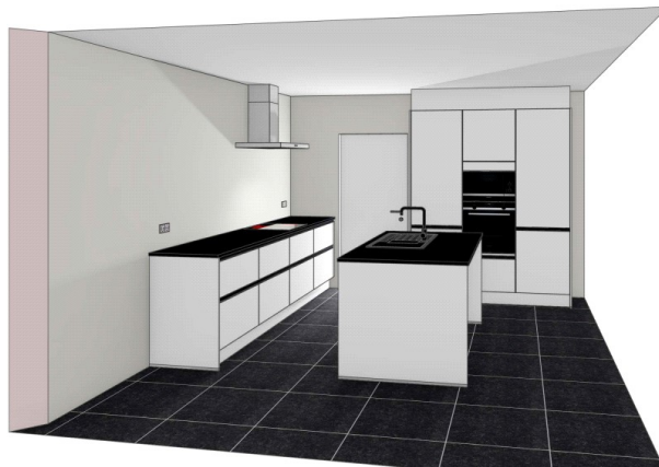
Schets bij benadering van de linkse woning, rechtse woning gespiegeld

(inclusief toestellen, inclusief aftappunt voor water/ijsdispenser Amerikaanse koelkast, exclusief Amerikaanse koelkast)