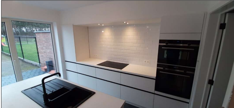
Foto boven/onder ter voorbeeld van de stijl/afwerking (Foto's van vorige realisaties, geen exacte overeenkomst) Opties/afwerking vrij te kiezen bij onze leverancier

De woning wordt voorzien van een volledig uitgeruste keuken in een modern design met greeploze witte kastdeuren en een werkblad in zwarte granietlook. In elke keuken zijn volgende toestellen ingebouwd: vitrokeramische kookplaat, dampkap met koolstoffilter, hetelucht oven, vaatwasser, microgolfoven. Alle bovenstaande toestellen van het kwaliteitsmerk SIEMENS.