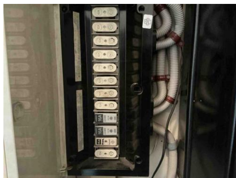
Geen gekoppelde inbreuk