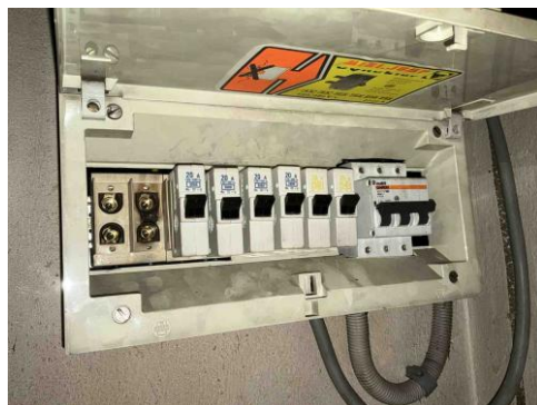
Geen gekoppelde inbreuk