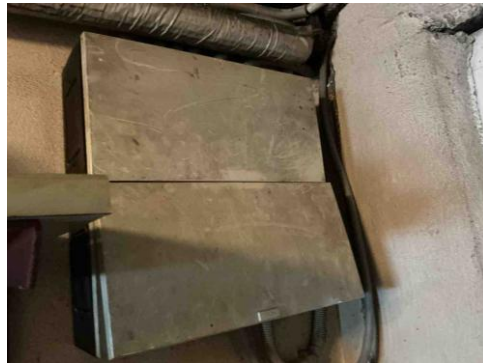
Geen gekoppelde inbreuk