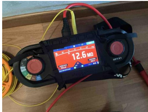
Geen gekoppelde inbreuk