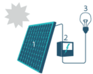
1. Zonnepaneel | 2. Omvormer | 3. Elektrische toestellen

Om de zonnepanelen optimaal te laten renderen, plaatst u ze tussen oostelijke en westelijke richting onder een hoek van 20° tot 60°.