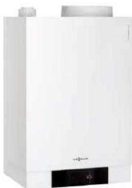
Viessmann Vitodens 111-W

Condenserende wandketel op aardgas (HR-TOP label) met ingebouwde boiler van 46 liter en een vermogen van 4,8 tot 35 KW.