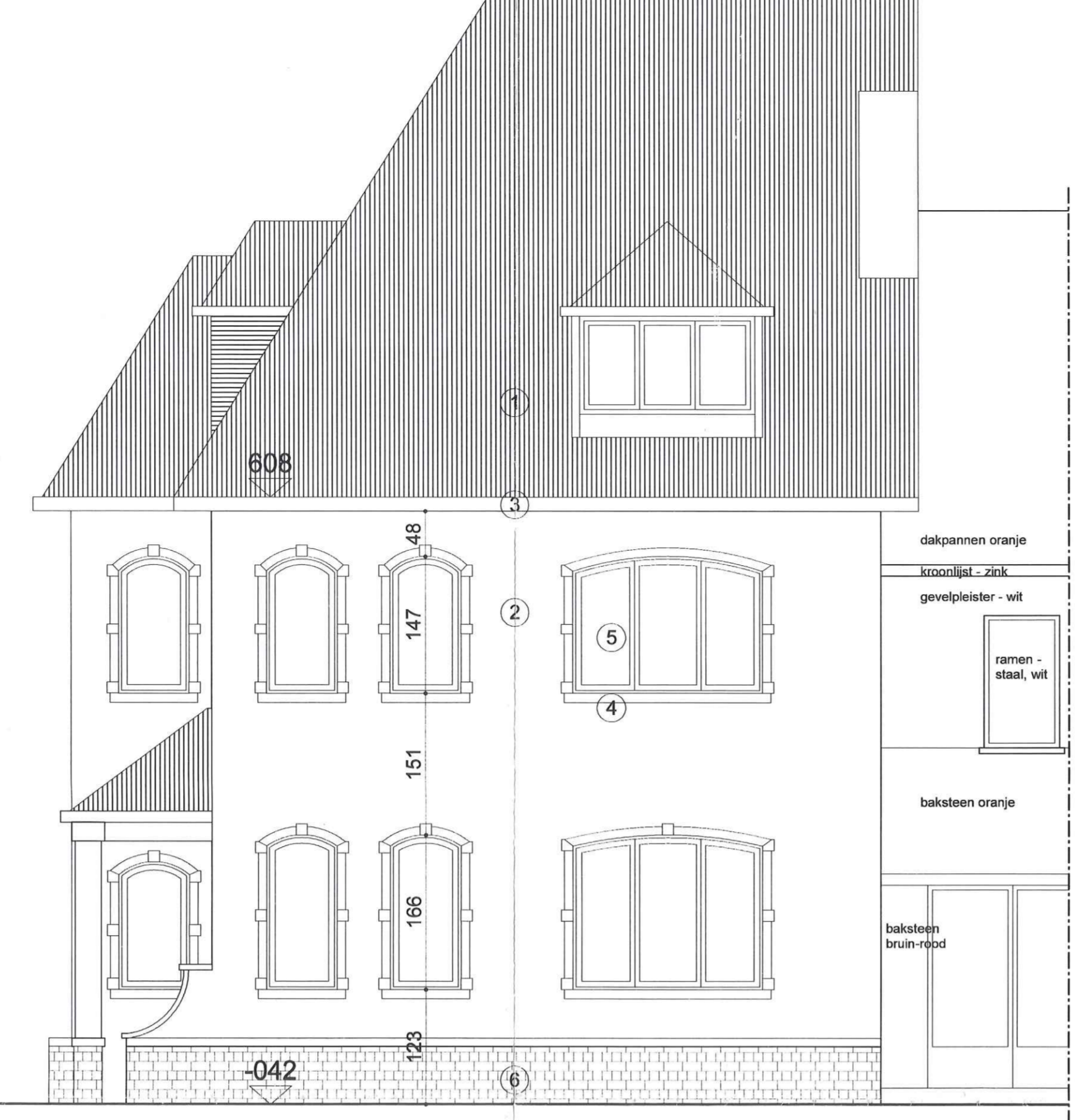
VOORGEVEL schaal 1/50 bestaande toestand = nieuwe toestand