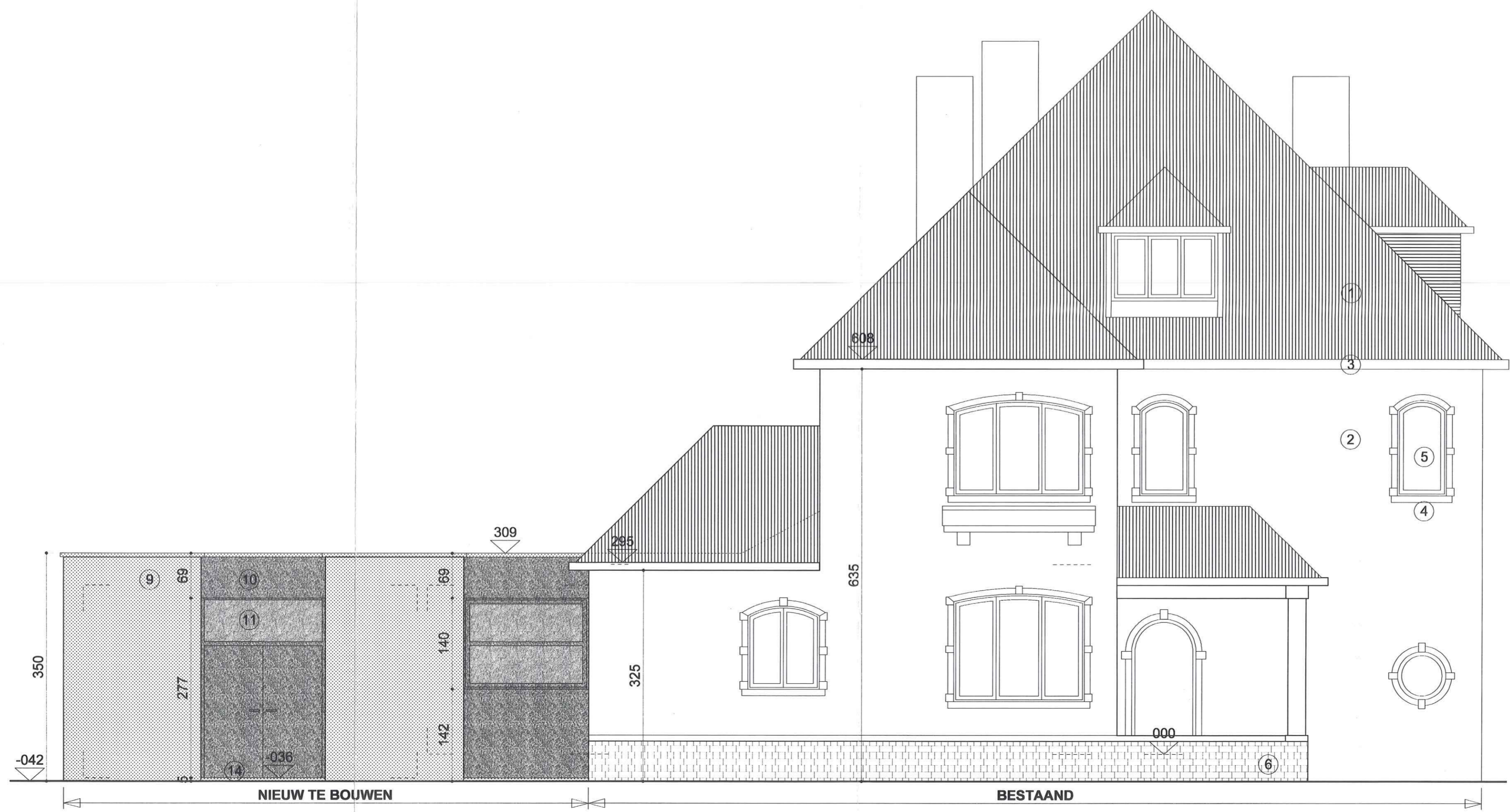
ZIJGEVEL LINKS schaal 1/50