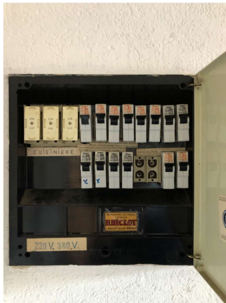
( Tableau électrique )