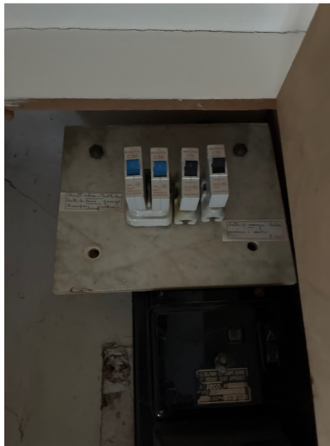
( Tableau électrique )