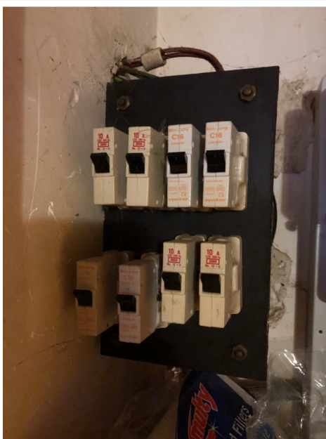
( Tableau électrique )