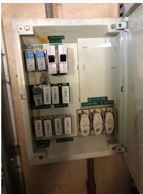
( Tableau électrique )