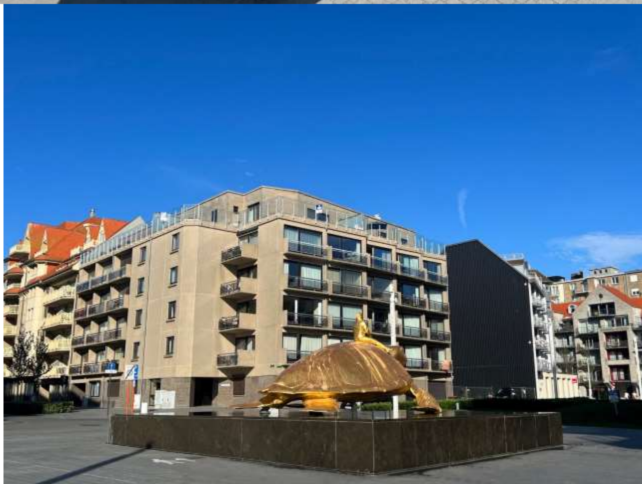
Lombardsijdestraat 11 8620 Nieuwpoort – info@immogroup-s.be – BIV 501.175 – 058/23.17.80