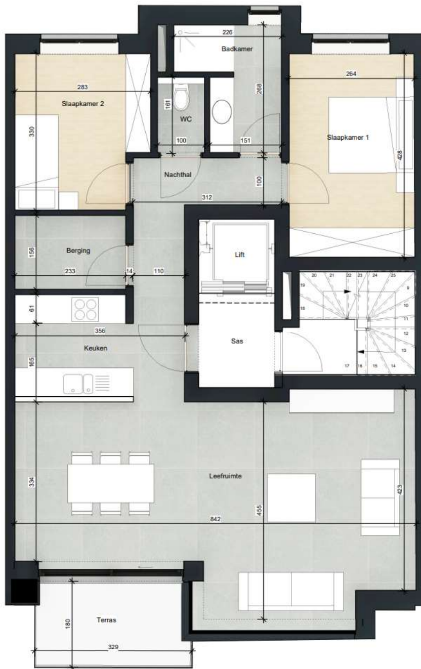
App. 1.1/2.1 (J.V Buggenhoutlaan) 2 slaapkamers Bruto opp.: 94.80 m 2