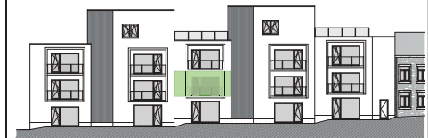
PLAN GENERAL :