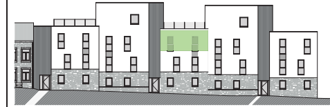
FACADE ARRIERE :