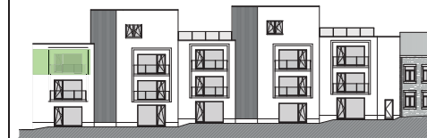
PLAN GENERAL :