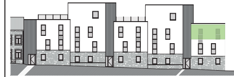
FACADE ARRIERE :