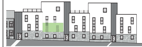
FACADE ARRIERE :