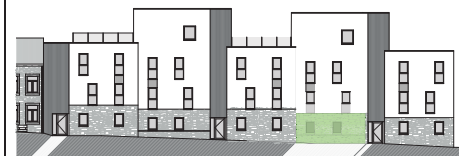
FACADE ARRIERE :