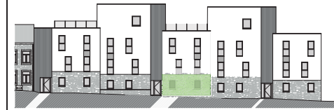
FACADE ARRIERE :