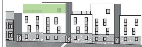
FACADE ARRIERE :