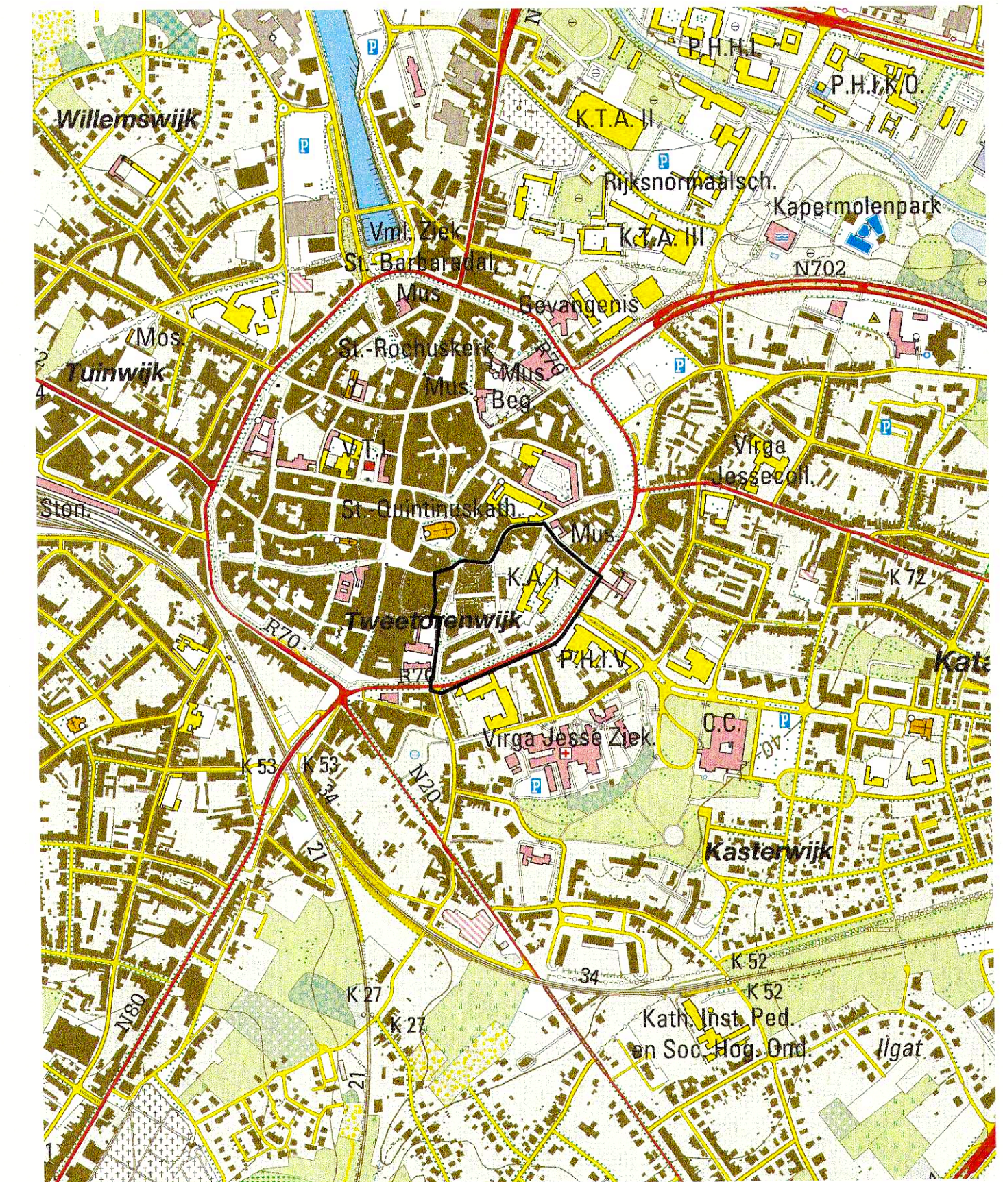
Ligingsplan (schaal 1/10 000)

Het verordenend grafisch plan is opgemaakt op basis van de beschikbare kadastrale kaarten, zijnde GRB toestand 15/11/2014 (AGIV), niet op basis van een volledig opmetingsplan. Bij interpretatie van de zoneringen dient rekening gehouden te worden met mogelijke afwijkingen van de werkelijke toestand omwille van het gebruik van deze kaarten als basis voor het grafisch plan. In toepassing van art. 4.6.5§1 van de Vlaamse Codex van 01/09/2009 worden alle verkavelingen van delen van verkavelingen binnen de grenzen van het RUP vernietigd na het in werking treden van dit RUP.