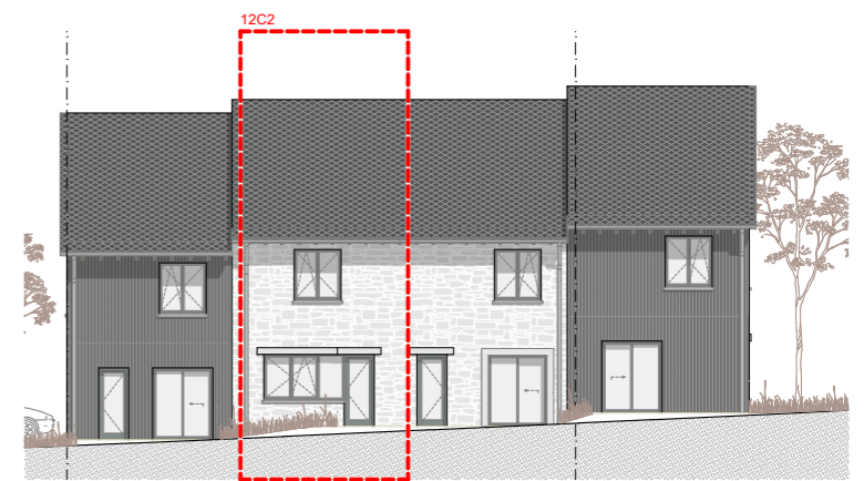
FACADE RUE - STRAATGEVEL