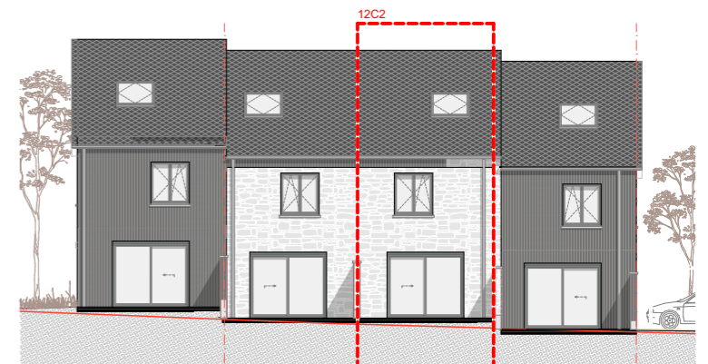
FACADE JARDIN - TUINGEVEL