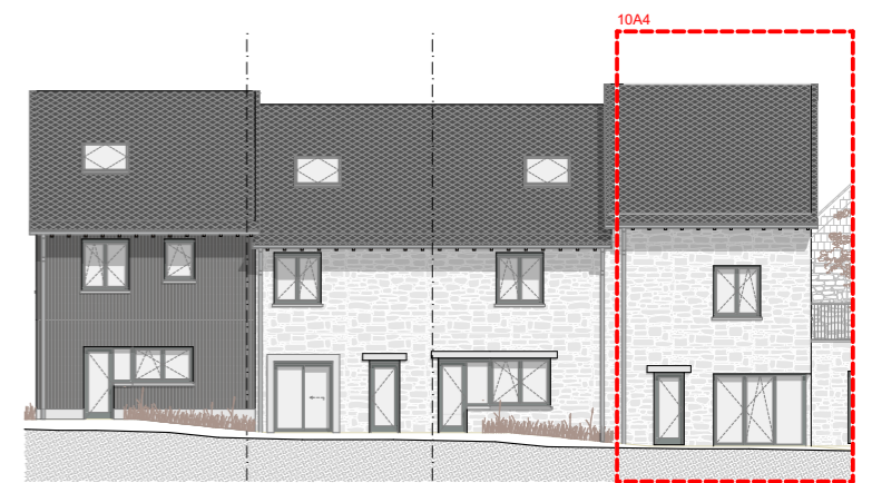
FACADE RUE - STRAATGEVEL