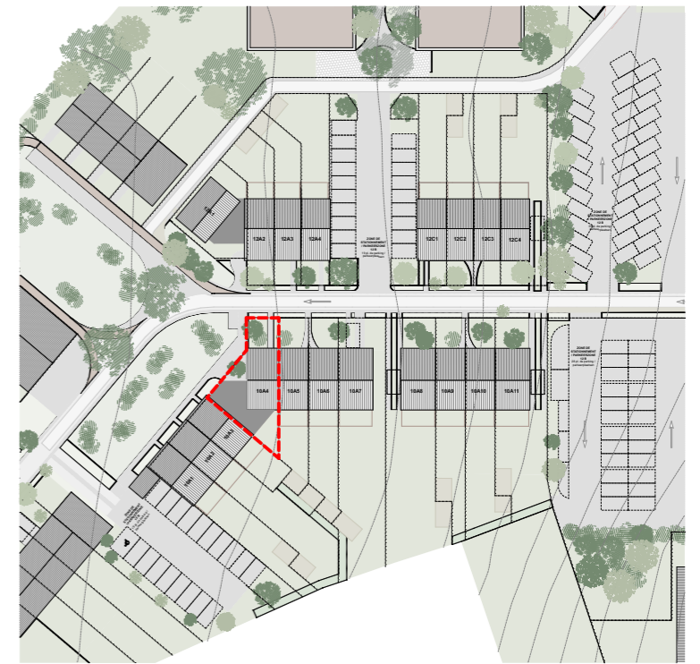
PLAN IMPLANTATION - INPLANTINGSPLAN