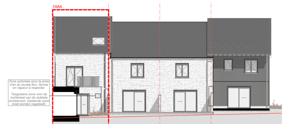
FACADE JARDIN - TUINGEVEL