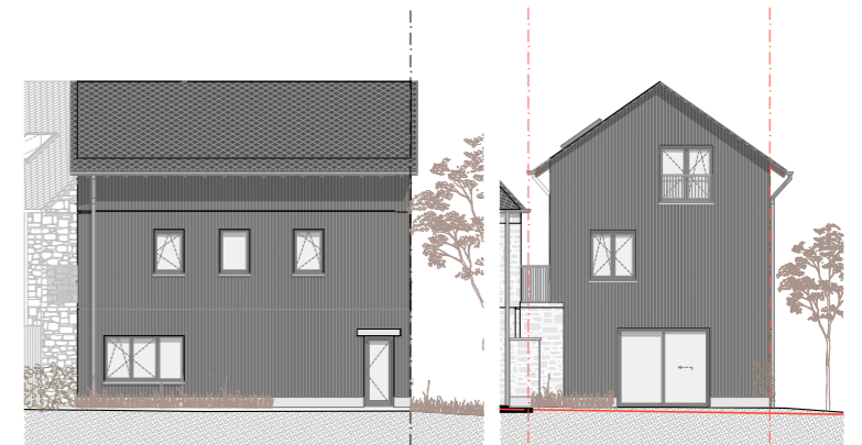
FACADE JARDIN - TUINGEVEL