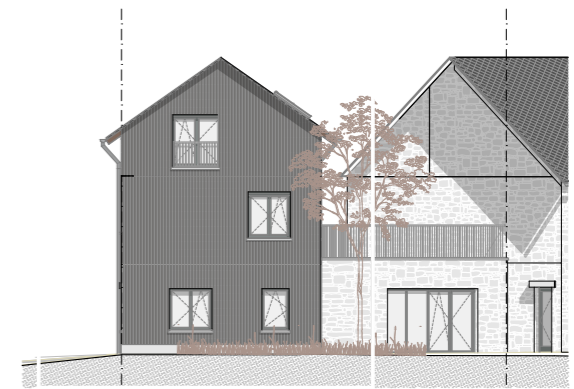
FACADE RUE - STRAATGEVEL