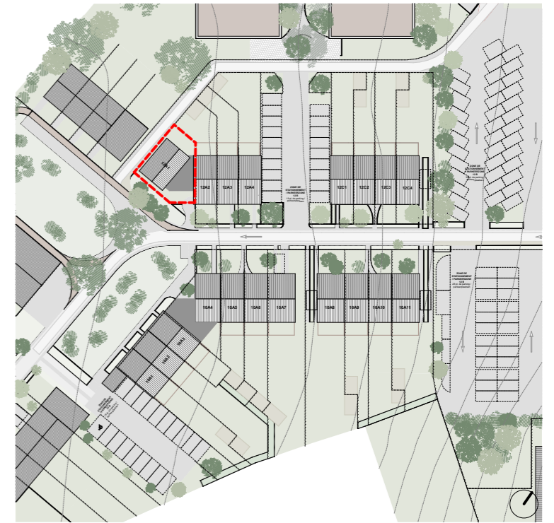
PLAN IMPLANTATION - INPLANTINGSPLAN