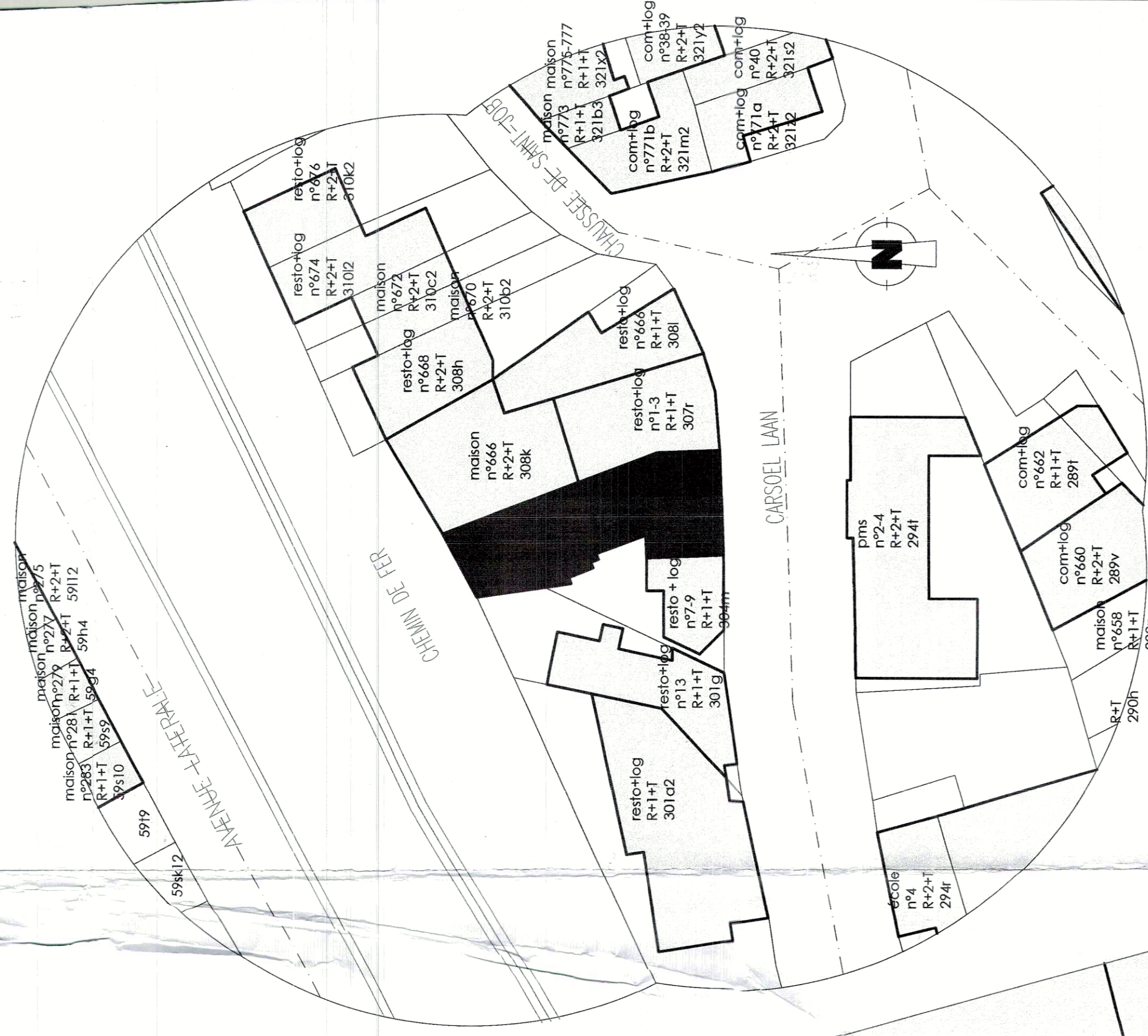
plan d'implantation 1/500