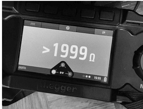
Geen gekoppelde inbreuk