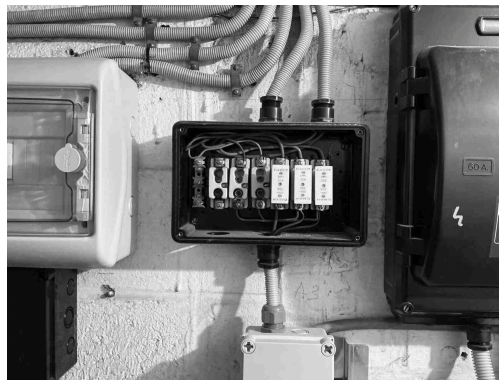
Geen gekoppelde inbreuk