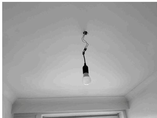
Geen gekoppelde inbreuk