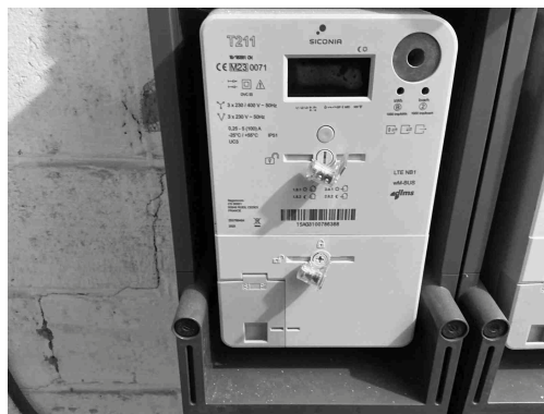
Geen gekoppelde inbreuk