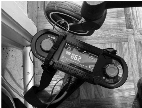
Geen gekoppelde inbreuk