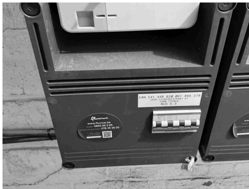
Geen gekoppelde inbreuk