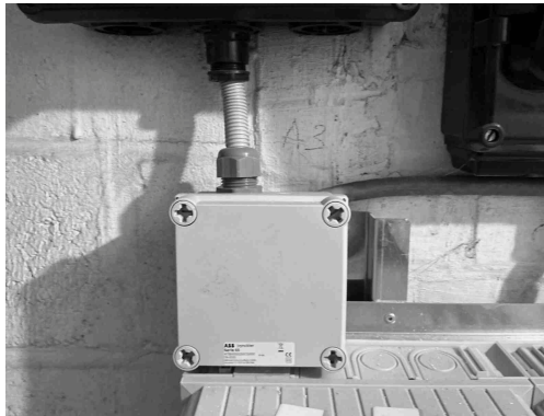
Geen gekoppelde inbreuk