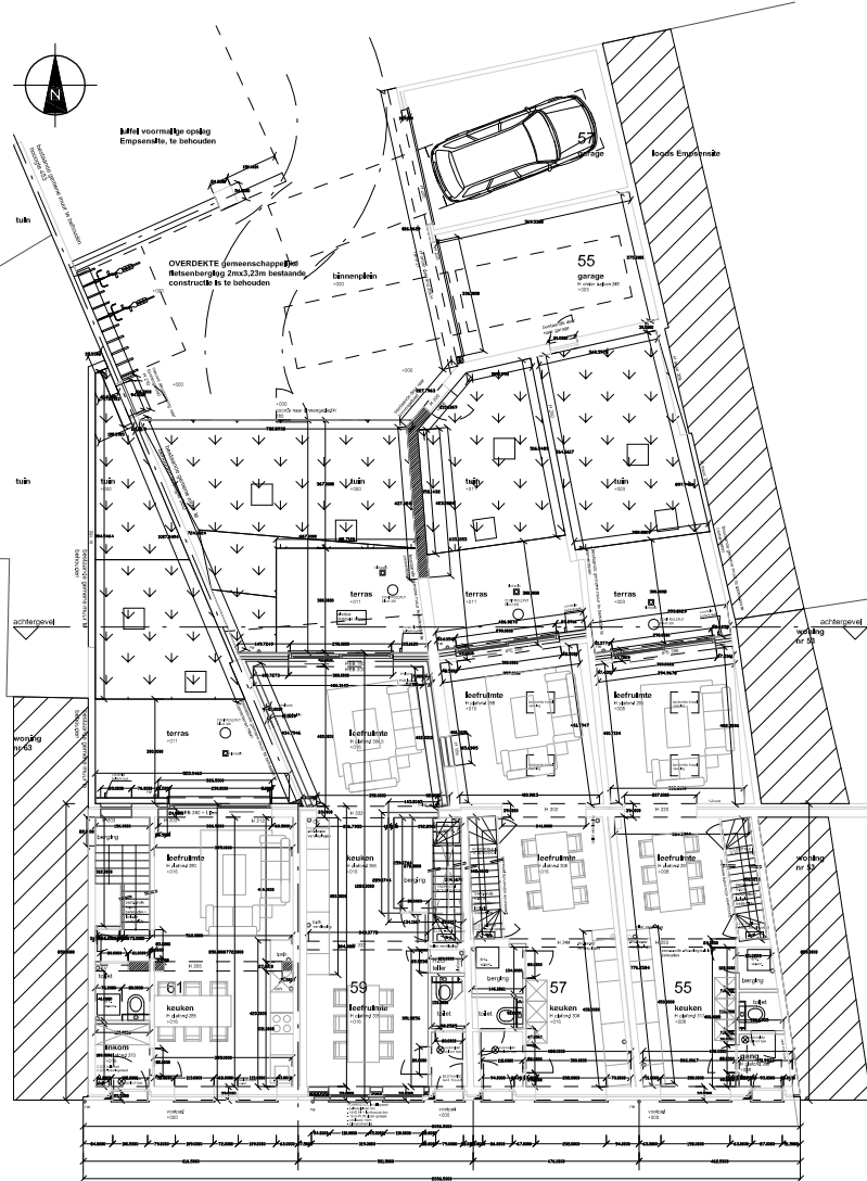
Nieuwe Toestand grondplan gelijkvloers woningen 61, 59, 57, 55, binnengebied